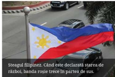
Steagul filipinez. Când este declarată starea de război, banda roșie trece în partea de sus.

Filipine are o aură aparte. Este o aglomerare din mii de insule și insulițe, plaje cu nisip perfect, ape verzui – turcoaz, jeepneey-uri