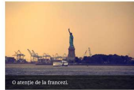
O atenție de la francezi.

Să obținem viza de SUA mi se părea cel puțin complicat și îmi imaginam deja maldăre de hârtii și hârtiuțe pe care trebuia să le strâng. Plus că mai