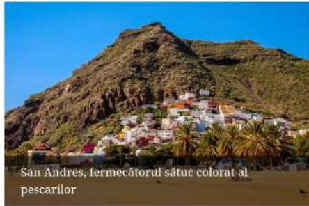
San Andres, fermecătorul satuc colorat al pescarilor

Insulele Canare sunt 7 la număr, și, deși de drept, fac parte din Spania, sunt la numai 100 km distanță de coasta Africii, pe direcția de zbor a vulturului. Și toate 7 au fost create de destrăbălarea vulcanilor, ba așa [...]