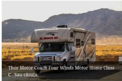
Thor Motor Coach Four Winds Motor Home Class C. Sau căsuța.