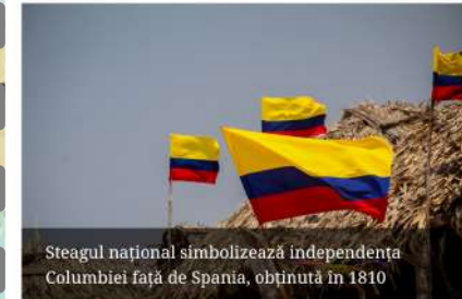
Steagul național simbolizează independența Columbiei față de Spania, obținută în 1810

În a doua zi de Columbia un șofer de Uber ne-a întrebat de ce am ales țara lui. Am zis atunci că am vrut un loc unde se vorbește spaniola, unde să